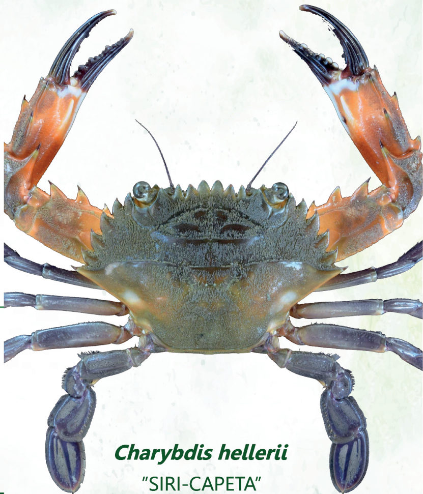
Charybdis hellerii "SIRI-CAPETA"